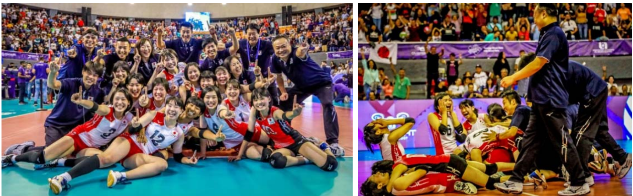
第20回女子U20世界選手権大会(@メキシコ)にて、女子U20日本代表チームが8戦全勝で初優勝を飾りました。

2019年7月23日(火)に開催された2019年度第4回理事会(臨時)の概要をお知らせします。